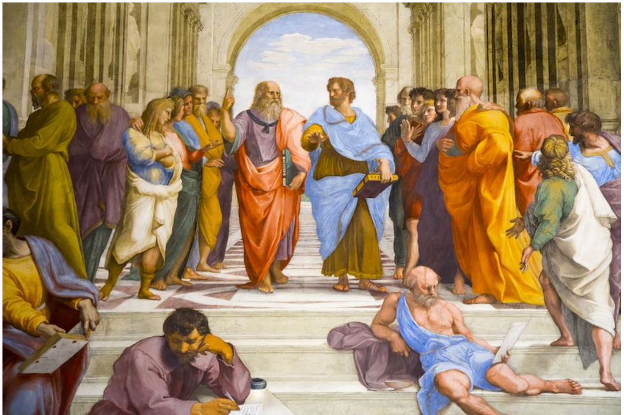
Πηγή: 'Plato's Academy', Athensguide.com, https://www.athensguide.com/plato-academy/index.htm .